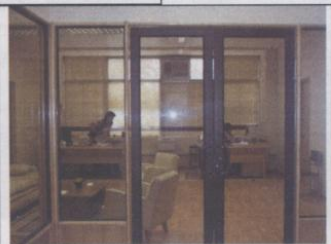
Oficinas del Decanato

De allí, que ha sido posible contar con nuevos espacios disponibles para reubicar la Escuela de Postgrado y el Decanato en el sector poniente del segundo piso del Pabellón G. Además, ha sido posible realizar un anhelado deseo de dar espacio físico a la Dirección Académica, integrándola con la nueva sección administrativa correspondiente a la Unidad de Gestión. En este nuevo sector se ha acomodado la Sala del Consejo de Facultad y una Sala de Reuniones para uso de las diferentes unidades académicas de nuestra facultad.