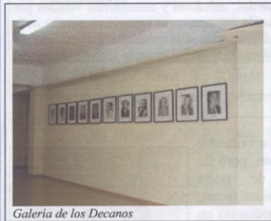
Galería de los Decanos

Con la entrega de los espacios que el Programa de Bachillerato ocupaba en el segundo piso del Pabellón G desde el año 1995, en el transcurso de enero se dio término a un periodo de apoyo que nuestra Facultad brindó a esta unidad académica por diez años.