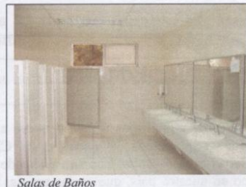
Salas de Baños