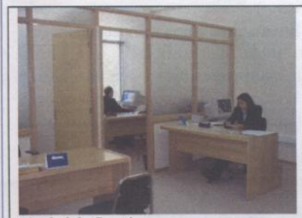
Unidad de Gestión

El Programa de Bachillerato hoy se encuentra haciendo uso de su propio edificio de cuatro plantas, contiguo al edificio del Pabellón G. Este proceso de facilidades se ha extendido por todo el primer semestre con el uso compartido de las salas de clases del primer piso y de los edificios de salas de clases A y B en el sector de los laboratorios, a la espera de que Bachillerato concluya su proyecto de edificio de salas de clases, a desarrollarse en el transcurso del presente año.